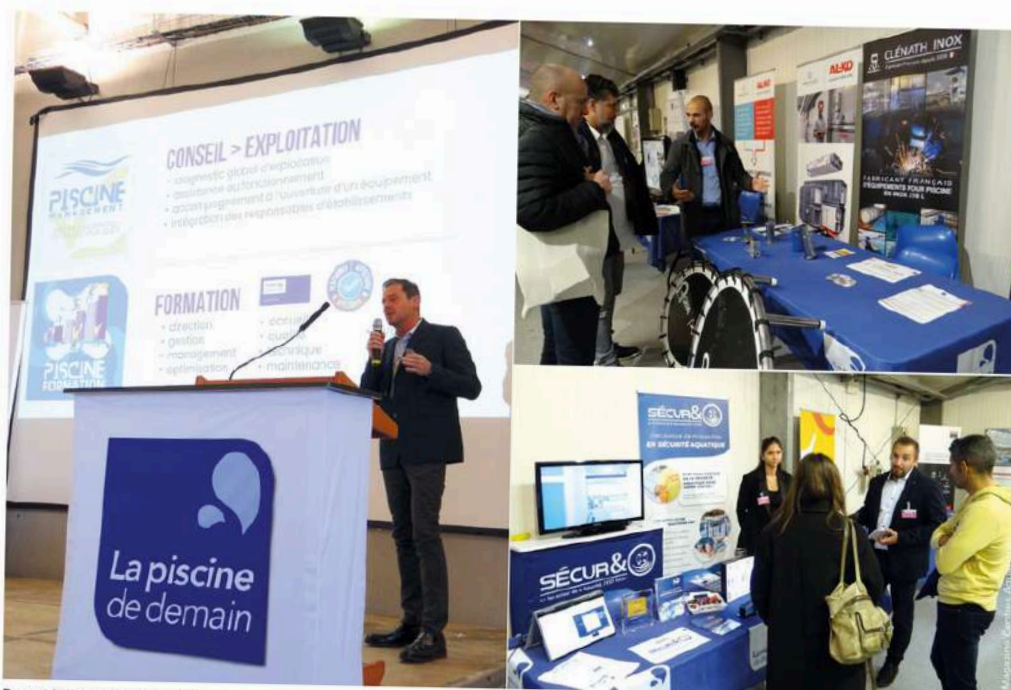
Durant les conférences, comme lors des échanges sur les stands des partenaires, il a beaucoup été question du rôle de la piscine publique dans la politique de la ville, de l'expérience client à améliorer, des formations du personnel et bien évidemment de l'optimisation énergétique.

Pour le 28 e colloque de La Piscine de Demain, les 300 participants (dont plus d'une centaine de sociétés partenaires parmi lesquelles se trouvaient une douzaine de nouvelles) se sont retrouvés à Antibes-Juan Les Pins. La thématique du jour concernait le rôle social et les enjeux sociétaux de la piscine publique de demain.